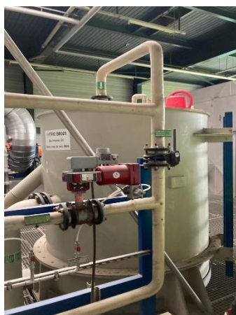
L'eau est purifiée.