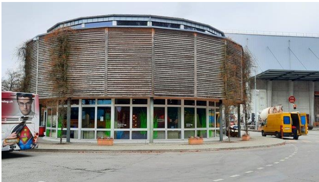
SAIDEF à Posieux

La SAIDEF signifie « S ociété A nonyme pour l'incinération des d échets du C anton de F ribourg ». Cette entreprise traite et valorise les déchets d'environ 160 communes fribourgeoises, vaudoises et bernoises ; non seulement, elle nous débarrasse de nos déchets, mais en plus, elle produit de l'énergie à partir de ces déchets.