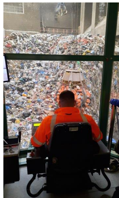
Le grutier commande le grapin