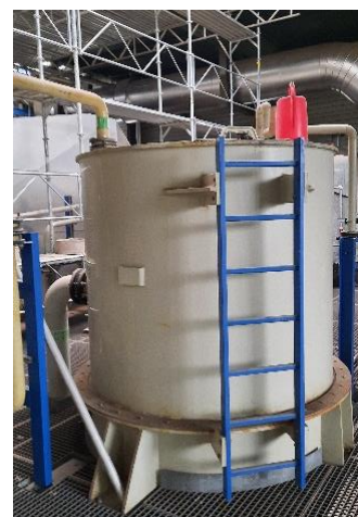
La fumée est nettoyée.