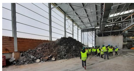
Métaux récupérés pour être Recycler.

Nous avons eu beaucoup de plaisir à découvrir ce site, c'était une sortie instructive et enrichissante.