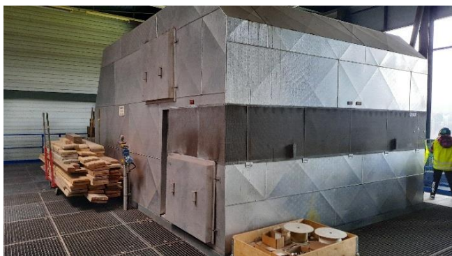
La chaudière récupère la chaleur qui transforme en vapeur l'eau contenue dans les tubes. Cette vapeur va permettre la production d'électricité.